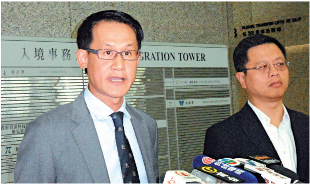
▲入境處助理首席入境事務主任蔡裕能(左)指，衝關產子很危險，呼籲孕婦不要以身試法

【本報訊】記者夏盧明報道：雙非孕婦衝關來港產子出新招！一對內地夫婦利用「假過境，真留港」招數，在落馬洲管制站詭稱過境香港轉乘飛機往印尼，過關時被入境處截查訊問，期間懷孕妻子作動，在管制站內產下男嬰。男嬰成功獲得居港權，但內地丈夫因為過關時出示的是在深圳以四十元買來的假電子機票，昨日被裁定管有虛假文書罪名成立，判監一年。