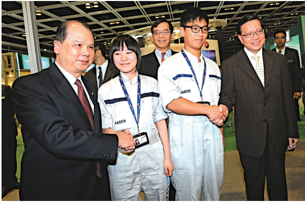
▲張建宗（左一）與張炳良（右一）昨出席由機管局與勞工處於會展舉行就業博覽

張建宗強調，繼續聽取不同持份者的意見，並會加強掌握市民脈搏，從而制訂更切合市民需要的勞工及福利政策。