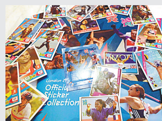
▲收集奧運貼紙及明星卡，也是體育迷參與奧運的方式

這次倫敦奧運的貼圖冊連3包，每包5張的套餐貼紙售價1.99英鎊（約24港元），每包貼紙75便士（約9港元）貼紙共有483種，絕大部分為英國運動