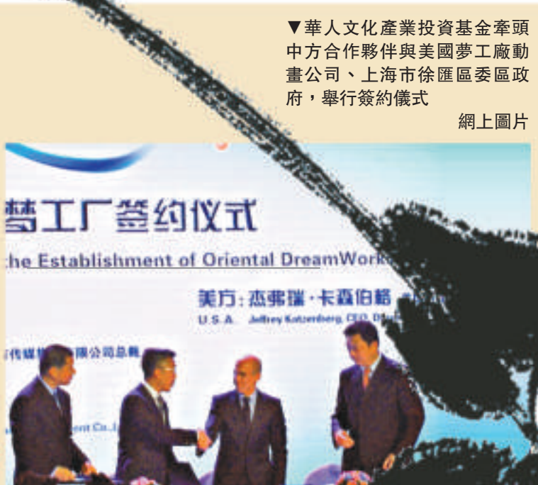
▼華人文化產業投資基金率領中方合作夥伴與美國夢工廠動畫公司、上海市徐匯區委區政府，舉行簽約儀式