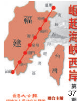
崛起海峽西岸 第377期 福建省人民政府新聞辦公室主辦

據悉，與福清戰略規劃相對應的產業轉型升級和基礎設施建設正在緊鑼密鼓地進行。其中，臨港產業集聚發展已漸成規模；江陰港區擴展配套建設正在加快推進；貫穿福清中心城區的母親河——龍江生態服務廊道正在形成；龍江東部新城建設已悄然啟動；打造中心城區道路框架的清繁路、清榮路、清昌路、清盛路的東延工程正在加快推進；沈海高速公路複線建設也在緊張推進。