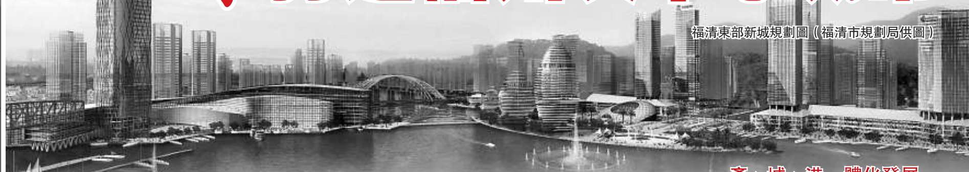
福清東部新城規劃圖 (福清市規劃局供圖)

8月4日，《福清市城鄉空間發展戰略規劃研究總報告》(以下簡稱「戰略規劃」)順利通過專家組評審。據福清市主管城市規劃工作的副市長葉小斌介紹：該規劃是閩省首個縣級城市正式編制城鄉空間發展戰略規劃，由代表國內規劃最高水準的中國城市規劃設計研究院編制。按照規劃，福清將作為聯動平潭發展的先行區，被打造成福州次中心城市，以及海西重要的現代製造業和臨港產業基地，建成生態、休閒、宜居的新僑鄉。