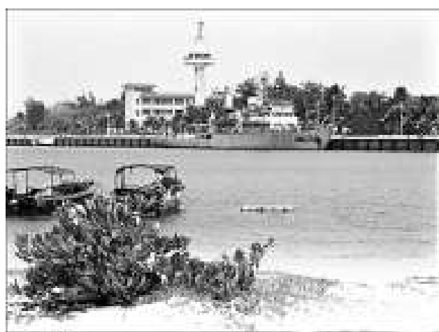
▲三沙市的設立，將進一步增強海南對西、南、中沙群島及其海域的管轄權，為海南從海洋大省向海洋強省邁進帶來了重要戰略機遇