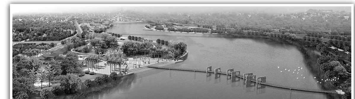
▲福清市母親河龍江沿岸生態公園規劃圖