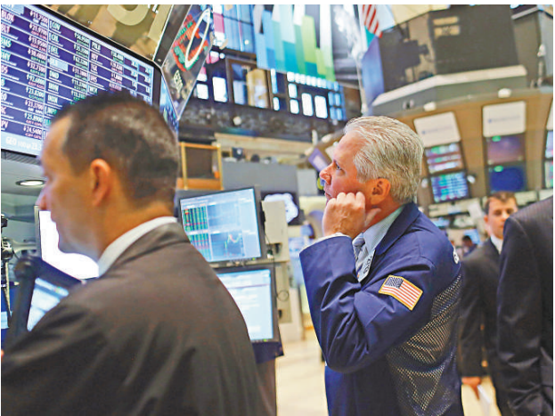
▲全球宏觀型基金報升，但專營沽售股票，以及多種策略的對沖基金則錄跌幅

分析指出，目前對沖基金經理顯然都採取觀望態度。對沖基金今年1月至7月期間升1.9%，低於全球股票7.5%的回報（包含股息）。彭博對沖基金指數7月錄得回報，該指數由2007年7月高位下跌12%。