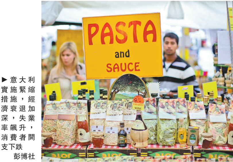
►意大利實施緊縮措施，經濟衰退加深，失業率飆升，消費者開支下跌

有分析指出，臉譜首先在英國「試水」是為測試用戶反應，若反應良好，則可能將遊戲推向美國。但與英國不同的是，在美國線上賭博並不合法。即使到時開發者通過境外平台使美國用戶線上賭博合法化，已經上市的臉譜也可能面臨退場。