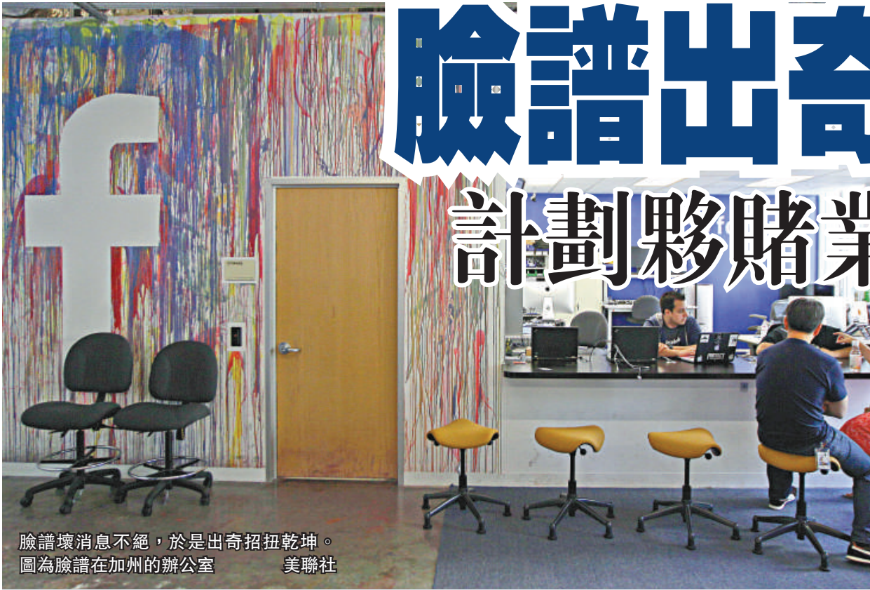
臉譜壞消息不絕，於是出奇招扭乾坤。 圖為臉譜在加州的辦公室