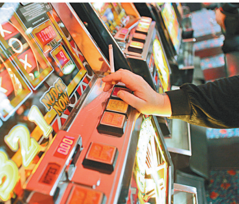
▲英國賭業受監管，臉譜先進軍英國