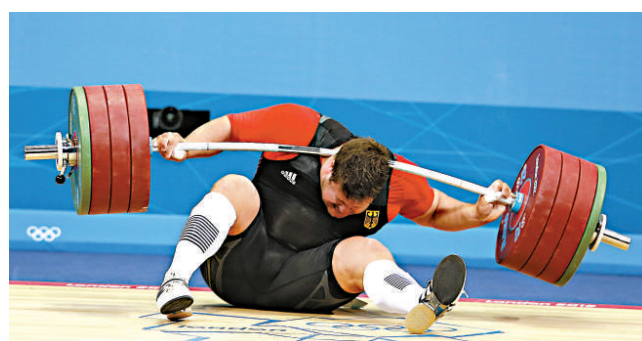
▲德國舉重運動員馬蒂亞斯·施泰納星期二被432磅的槓鈴壓住頸部

如此「缺金」格局，不僅與俄羅斯2008年北京奧運會上「23金」的第三名位置相去甚遠，要完成本屆奧運賽前所期望的「戰勝英國保持第三」目標，更有不小的壓力。