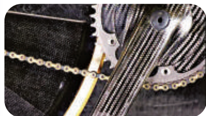
▲單車的曲柄由180條碳纖維製成

車把： 車把形狀也是按照動力學設計。由於沒有剎車，所以選手依靠反踏腳板來減低車速。除了一個固定的齒輪，單車並沒有傳動齒輪裝置。惟一的這個齒輪會幫助單車手在行進過程中迅速達到最高速度。