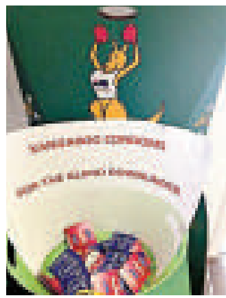
▲布坎南在推特上發布的安全套照片

這位發言人表示，「我們會好好調查此事，並要求不把這些安全套分發給其他運動員，因為杜蕾斯是我們的供應商。」