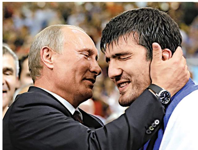
▲8月2日，俄羅斯總統普京（左）向奪冠的俄羅斯選手塔吉爾·凱布拉耶夫表示祝賀

健康： 頂級運動員的身體都經過嚴格訓練，任何輕微的細菌感染都可能嚴重影響他們在賽場上的表現。英國的單車手們當然深知這一點，他們會隨身帶着自己的枕頭，因為飯店房間的枕頭可能攜帶了病菌。基於同樣理由，他們在2008年的北京奧運會期間都是乘坐自己的專用車，而沒有選擇奧委會的免費接送巴士。