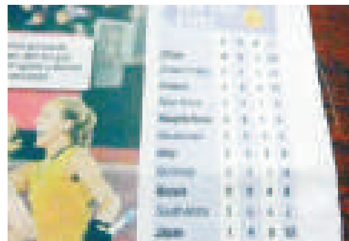
▲澳洲一家報紙將韓國和朝鮮分別稱為「乖巧的韓國」和「頑皮的朝鮮」

據悉，真正戲謔朝鮮國名的其實並非是朝中社文中所言的《布里斯班都市報》，而是布里斯班一家名為mX的報紙，該報幕後老闆正是傳媒