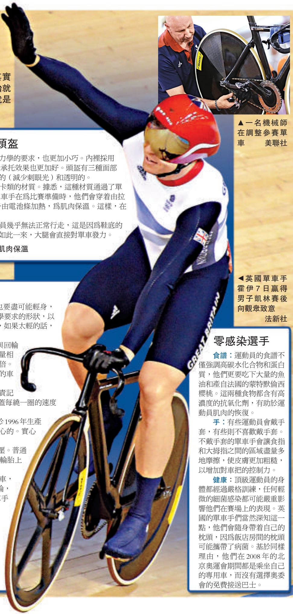
▲一名機械師在調整參賽單車