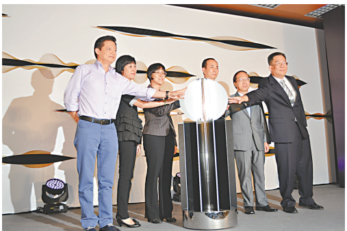
▲ 眾嘉賓為澳門國際音樂節開幕亮燈

東寧口岸為中國北方唯一被國家批准可以進口鑽石口岸的口岸和東北三省唯一進口鑽石、寶石、玉石的專業口岸。為使寶玉石文化與佛教文化結緣，促成世界上最大的翡翠工藝品安放於產業基地，供寶玉石業內人士和廣大旅遊者參拜、觀摩。重近六噸、高四米世界最高的立式翡翠玉觀音，已運至東寧，舉行現像法會；淨重五十六噸的坐式翡翠玉觀音，也很快將運抵東寧，將在八月二十五日東北亞寶石文化節上舉行現像法會，東寧金光寺將組織千位僧人和上萬居士為其誦經，數萬名佛教信眾和遊客將前來參拜和觀光。