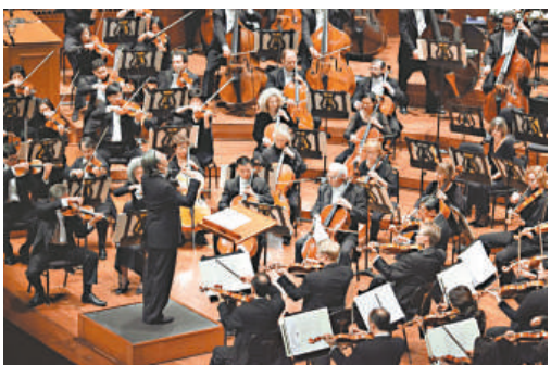
▲ 開幕演出是三藩市交響樂團與鋼琴家王羽佳合作音樂會