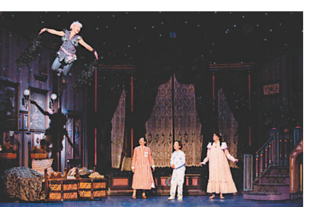
▲ 百老匯音樂劇《小飛俠》為今屆音樂節開幕

本屆澳門國際音樂節門票將於八月十二日在澳門售票網公开发售，查詢可電（八五三）八三九九六九九或瀏覽 www.icm.gov.mo/fimm。