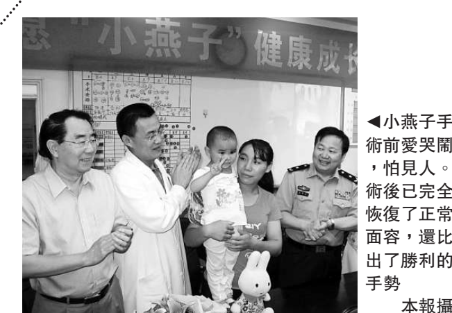
◀ 小燕子手術前愛哭鬧，怕見人。術後已完全恢復了正常面容，還比出了勝利的手勢