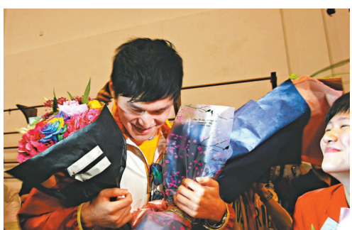
▲孫楊（左）回到杭州後獲贈鮮花，旁為葉詩文

中國游泳新星孫楊在本屆奧運會上豪取2金1銀1銅，他的身價正如此前所預料一樣，一路飆升。有人說，孫楊會是下個劉翔。對於這種說法，孫楊謙虛地回應，「我並不那麼認為，劉翔、李娜都是非常優秀而且偉大的運動員，我跟劉翔還有很大的差距。」