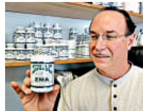
▲有興奮劑「教父」之稱的維克托·孔特 資料圖片

郊區的一所反興奮劑實驗室裡爭分奪秒地檢測來自倫敦奧運期間的6000份尿液和血液樣本。上萬名的奧運參賽運動員們被要求在任何時間任何地點都要配合檢測，包括跑道上、泳池邊、運動員村或者私人住處。已有數人因服用禁藥被驅逐出了本屆奧運會。