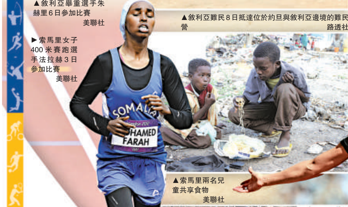
▶索馬里女子400米賽跑選手法拉赫3日參加比賽