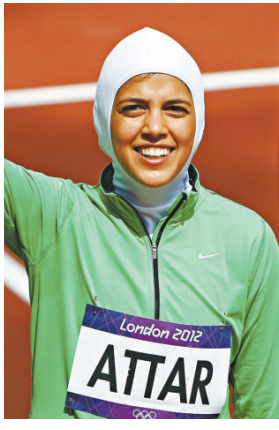
▶第一位參加奧運會的沙特跑步運動員莎拉·阿塔爾

這兩位女選手，在奧運會開幕式上，被迫走在沙特國家隊男運動員後面，這很能說明沙特這個極端保守的國家重男輕女的觀念。事實上，該國不鼓勵婦女參加體育運動。但兩位沙特女運動員在這次奧運會賽事上，都受到觀眾的熱烈歡迎。她們的出賽，是沙特邁向男女平等的巨大一步。