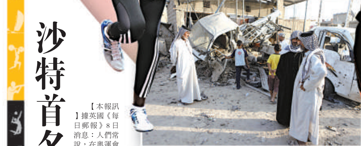
▲伊拉克居民8日站在爆炸過的汽車炸彈旁