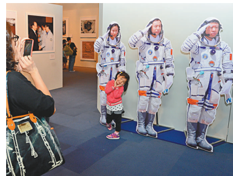
▲小女孩興致勃勃地與航天員的人形展板合照