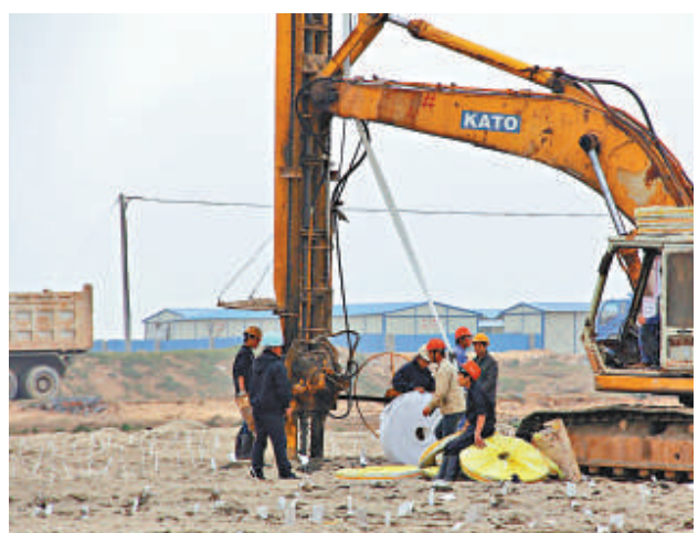
▲總投資380億元的「橫琴新區綜合開發項目」將改善當地基礎設施條件，拓展橫琴發展空間

據透露，為增加場館商業配套，深圳市規劃國土委近期將細化大運場館周邊地區的發展規劃，支持龍崗區和運營公司增加必要的商業性配套設施。由於建設商業配套需要時間，未來五年內深圳市政府將每年給予大運中心3000萬元的財政補貼，此外還將在水、電、稅、費等關乎場館運營的相關政策上，給予大運中心運營方一定傾斜，以支持場館市場化運作。