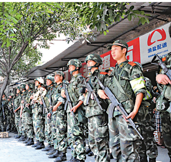
▲武警在重慶主城區邊的山洞鎮集結，準備向歌樂山進發