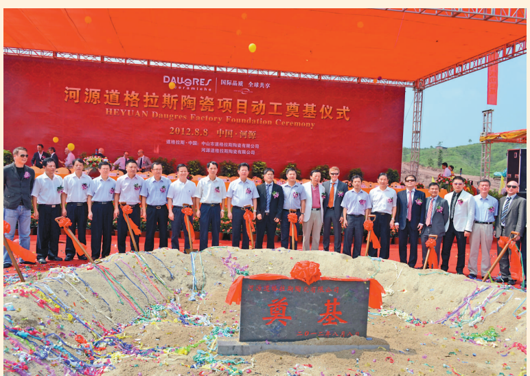
▲道格拉斯陶瓷項目奠基儀式現場

由意大利建築陶瓷品牌企業——河源道格拉斯陶瓷有限公司斥資28.82億元建設的道格拉斯(河源)建築陶瓷生產基地日前在東源縣的新型環保建材基地駱湖鎮奠基開工建設，首期2條生產線計劃在2013年9月建成投產。