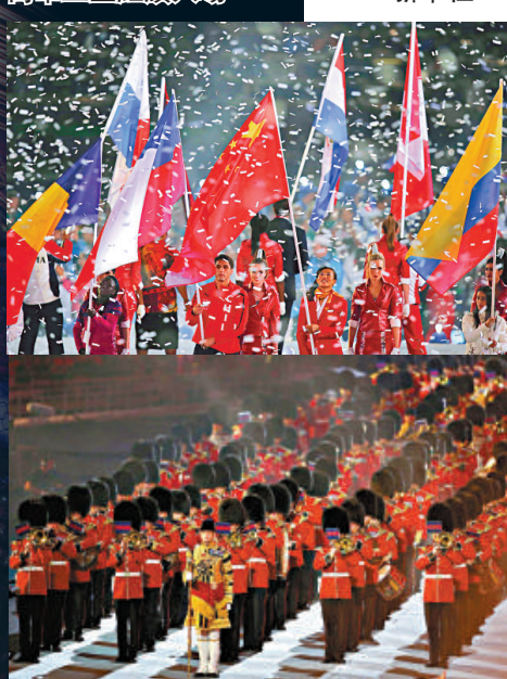
△英國軍樂團在閉幕式上演奏著名樂團Blur的歌

【綜合本報記者黃念斯及外電倫敦十三日電】當地時間12日晚，英國人以「英國音樂交響曲」大型派對為主題，向全球奉上一場長達3小時的閉幕式表演，狂歡一夜告別倫敦奧運。