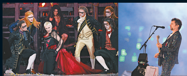
▲Annie Lennox (中)