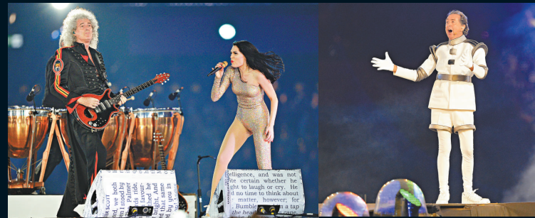
▲Jessie J與「王后」樂隊的結他手Brian May (左)