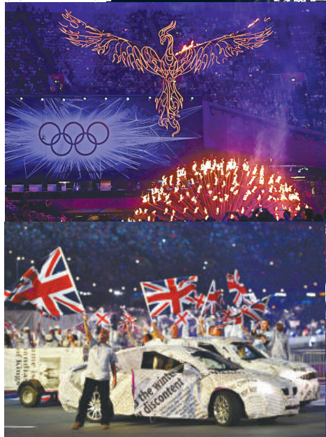
▲演員們在報紙搭成的「迷你倫敦城」中行走