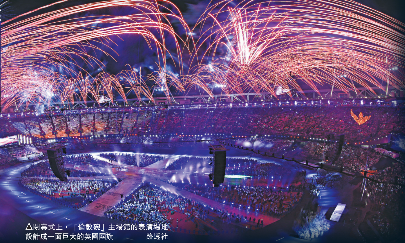
△閉幕式上，「倫敦碗」主場館的表演場地設計成一面巨大的英國國旗