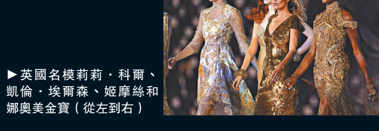
▶英國名模莉莉·科爾、凱倫·埃爾森、姬摩絲和娜奧美金寶(從左到右)

「誰人」(The Who)樂隊在一次喧鬧、充滿滾滾的奧運閉幕式中高唱：「我在談我那一代。」這支樂隊的成員，最初唱《My Generation》一曲時，只有20歲，現在他們也快將70歲了。