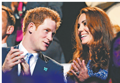
▲哈里王子(左)與凱特12日代表王室出席倫敦奧運閉幕式

女王也向英國以及英聯邦的運動員發來祝賀，稱他們的努力「贏得了世界的尊重」。今年10月23日，英女王與王夫將在白金漢宮會見英國奧運代表隊的成員。