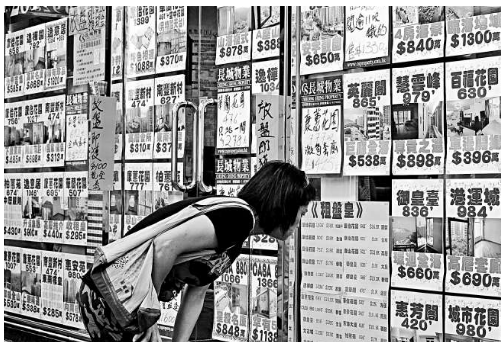
在供求尚未均衡下，樓價升勢與實際經濟表現嚴重脫節