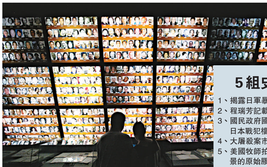
▲14日，人們在侵華日軍南京大屠殺遇難同胞紀念館內參觀