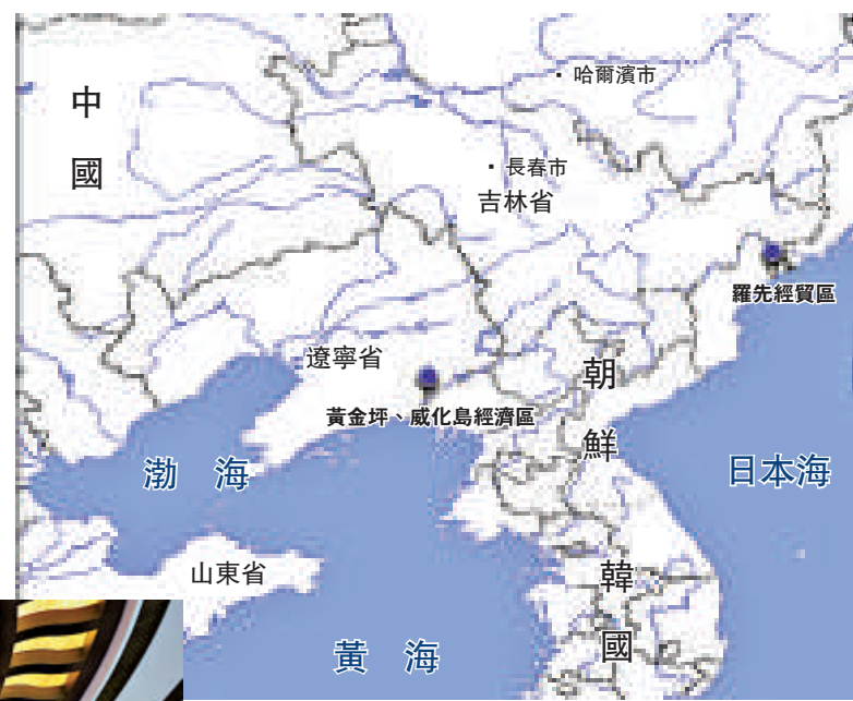
▲羅先經濟貿易區及黃金坪、威化島經濟區位置圖

【本報訊】朝鮮勞動黨中央行政部部長張成澤率領代表團13日抵達北京，14日出席「羅先、黃金坪、威化島經濟區聯合指導委員會第三次會議」。中朝一致認為，兩個經濟區開發合作已取得顯著成果，進入實質性開發階段。