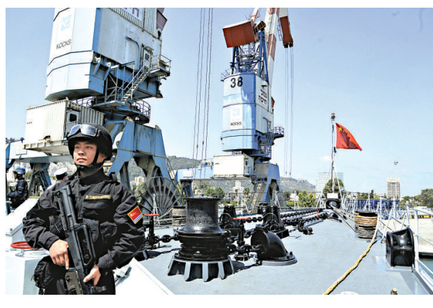
▲13日，由中國海軍第十一批護航編隊「青島」號導彈驅逐艦、「煙台」號護衛艦、「微山湖」號綜合補給艦組成的出訪編隊抵達以色列海法港

雲南地處中國西南邊陲，處於鐵路網的末梢。玉蒙鐵路的建設不僅是對當地經濟的拉動，更大範圍來說是擴大中國與東南亞、南亞國家往來的重要通道。