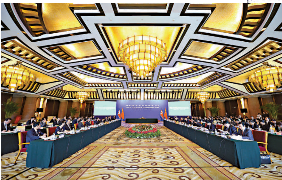
▲14日，中朝共同開發和共同管理羅先經濟貿易區和黃金坪、威化島經濟區聯合指導委員會第三次會議在北京召開

報道還稱，張成澤一行15日、16日將參訪江蘇和浙江，17日返回北京會見中國國家主席胡錦濤、總理溫家寶等最高層領導人，18日返回朝鮮。