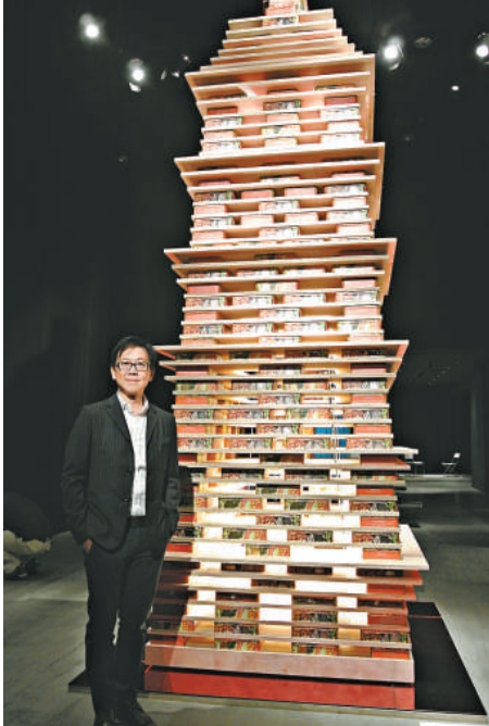
▲林偉而最新作品《中秋塔》，由六百多個回收的月餅盒夾板製作而成 本報攝