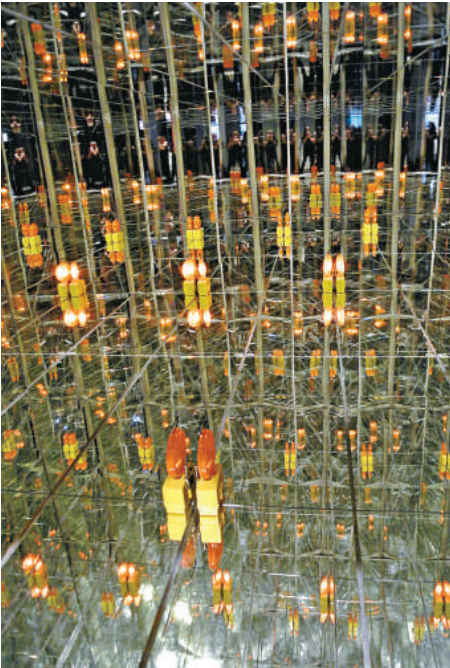
▲《非法進入》內四面都是鏡，視覺上的放大跟本身狹窄形成強烈對比 本報攝