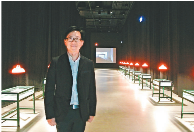
▲林偉而設計的展場入場通道