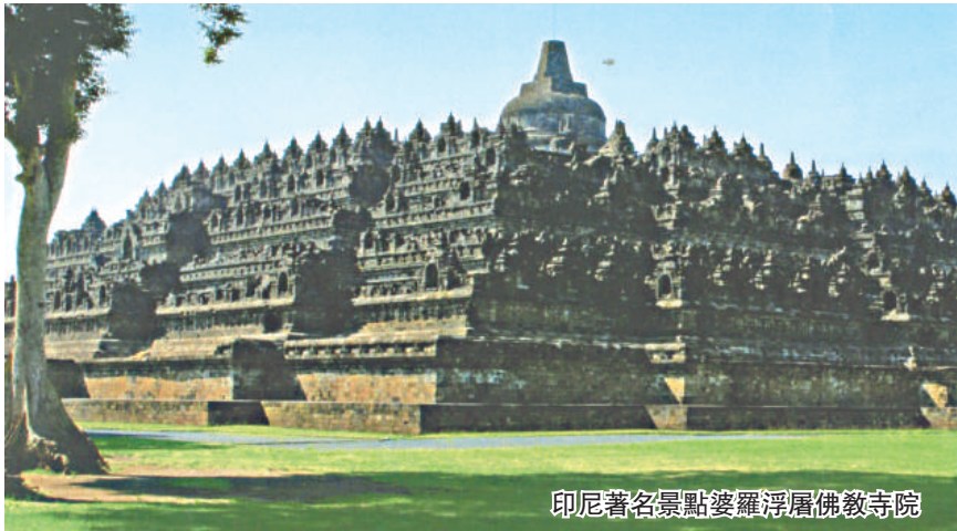
印尼著名景點婆羅浮屠佛教寺院