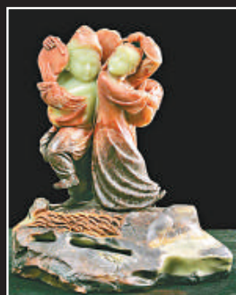
《五十六個民族——潮州族》