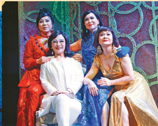
在《我和秋天有個約會》中四位「春天」的女主角於夢裡重聚