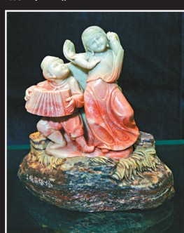
《五十六個民族——塔塔爾族》

由兩岸策展人聯手打造的「四大名石鑒賞活動」正在上海舉行。四百件以中國四大名石為材料創作的雕刻作品匯聚一堂。上海置磊藝術品交易中心以石會友，推廣中國四大名石文化。