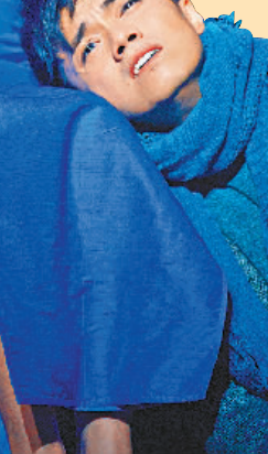
Danny與亡母鳳萍在夢中相見