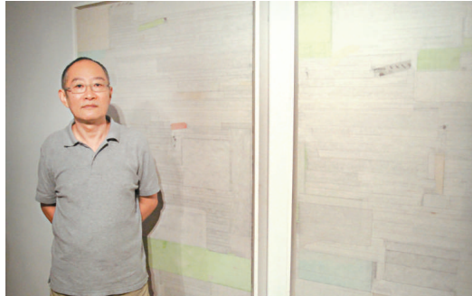
梁銓作品皆以宣紙拼貼而成，傳達「靜」之思想