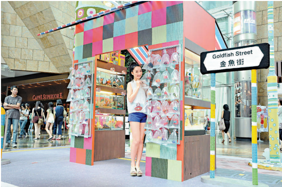
▲本港藝術創作團隊創作的手織金魚店