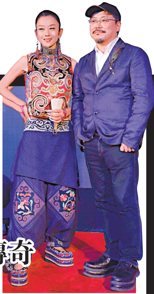
◀楊麗萍演出大型舞劇《孔雀》宣傳海報