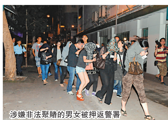
涉嫌非法聚賭的男女被押返警署

昨日凌晨一時許，警方元朗警區刑事部及特別職務隊，聯同新界北總區警察機動部隊共一百人，在元朗區展開代號「犁庭掃穴」的反三合會行動，打擊黑社會收入來源。同一時間突擊搜查炮仗坊內四個目標單位，利用老虎鉗和鐵錘破門而入，當場