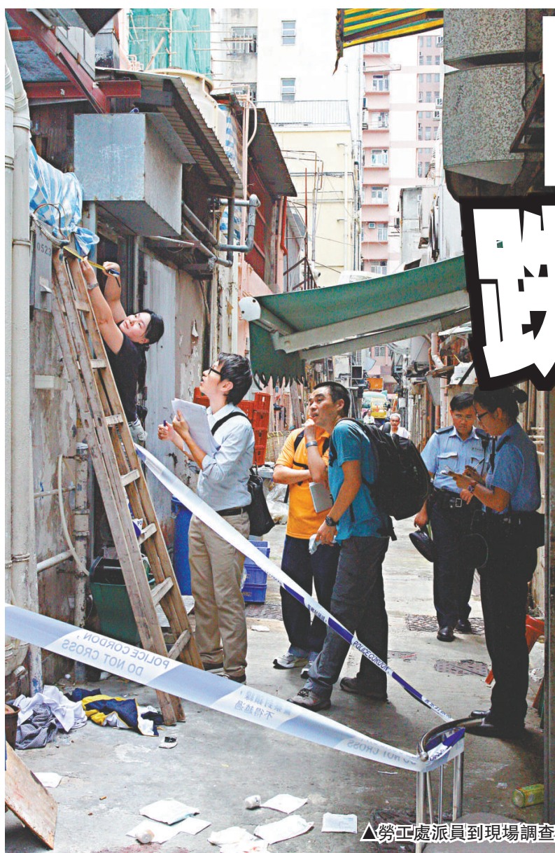
▲勞工處派員到現場調查