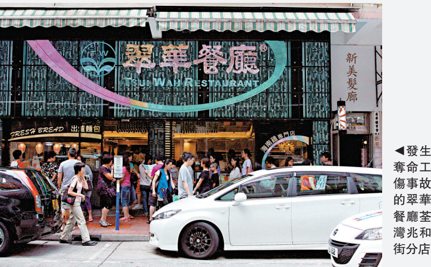
▲發生奪命工傷事故的翠華餐廳荃灣兆和街分店

此外，消息指由於翠華因為是香港著名品牌，計劃在內地開設十間分店，會走高端路線，消費較香港更高，加上人民幣升值，令內地業務利潤更高。 翠華於一九六七年由蔡劍波創辦，前身是一間位於旺角甘肅街的冰室，因沒有熟食供應，七十年代時顧客希望在冰室能吃到西餅麵包以外的東西，自此廚房與水吧「分道揚鑣」，衍生出茶餐廳，翠華正式成為茶餐廳，而首間翠華茶餐廳則在新蒲崗開業。