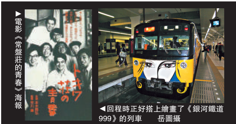
▲回程時正好搭上繪畫了《銀河鐵道999》的列車 岳圖攝

►中華料理店松葉昔日是眾漫畫家吃飯及高談闊論之處，如今門前尚有藤子不二雄畫的作品展示 岳圖攝 ▼常盤莊紀念碑下方有多位漫畫家自畫的肖像 岳圖攝