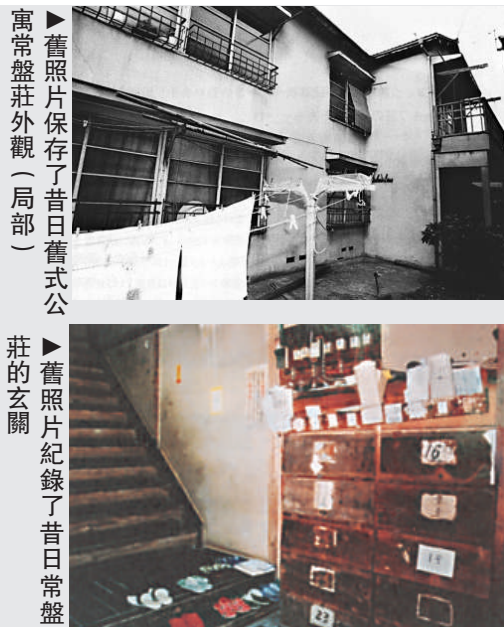
▲舊照片保存了昔日舊式公寓常盤莊外觀（局部）

二〇一一年二月我去杉並動畫博物館參觀「常盤莊——為漫畫獻出的青春」展覽（網址： http://www.sam.or.jp ）（館長鈴木伸一也是常盤莊一員，《Q太郎》中戴眼鏡天天都要吃湯麵的角色就是他）。館中展出珍貴畫稿、舊雜誌、照片，放映他們拍的黑白影片，常盤莊一些物件；一道紙門上留下了多位漫畫家的畫像，更將寺田廣夫的房間重現。小而簡樸的房間內只有書桌飯桌和一