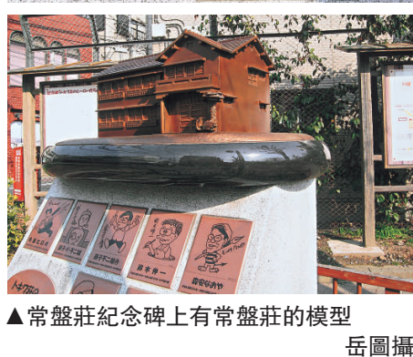
▲常盤莊紀念碑上有常盤莊的模型