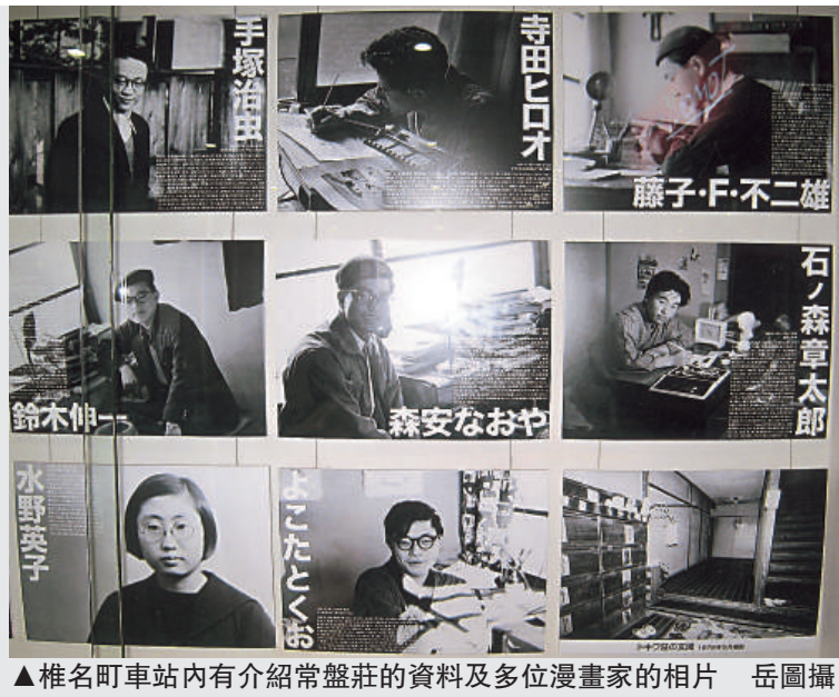
▲椎名町車站內有介紹常盤莊的資料及多位漫畫家的相片

些櫃子，特別令人注意的是一袋袋畫稿很多，飯桌很小，比書桌更小，彷彿看到當年漫畫家在斗室內過着簡樸生活，默默筆耕，栽種出一片漫畫的沃土。