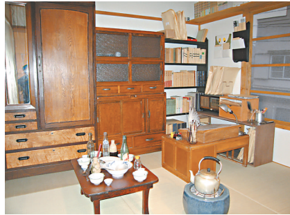
▲杉並動畫博物館裡重現了當年常盤莊內寺田廣夫居住及創作的小房間