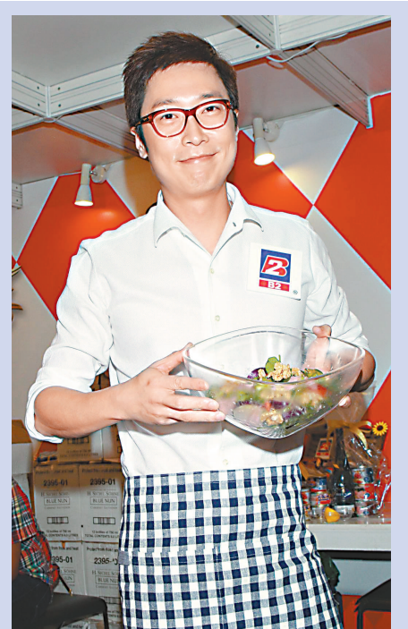
▲馬仔自爆有意跟前女友復合

不過內地有很多「乳牛」盛行，馬仔稱都認識不少新朋友，有些也是好女生，並非一定是情愛關係，加上若要給予對方信心，最重要是他先改變自己的問題。說起科技，問到傳短訊的內容會否很小心？馬仔承認拍拖的情侶防範是會減弱，有調情的情話亦在所難免，但若分手就公開出來不是太好，而且他和前女友都很成熟，不擔心會有此問題發生。