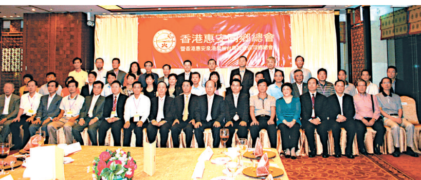
▲香港惠安同鄉總會與各地慶賀團主要首長合影

深圳副市長唐傑表示，羅湖區號召全區公職人員、愛心企業、愛心人士參與扶貧幫困，實現轄區困難群眾「一幫一」幫扶全覆蓋。這些惠民生的好事、實事，體現了羅湖區委區政府、羅湖的民政部門在踐行以民為本、為民服務、關愛弱勢群體、採取各種措施努力讓轄區群眾共享改革開放成果方面又走在了全市的前面，值得充分肯定。但為民服務，永無止境，在「創新開路」的引領下，今後應該繼續加強制度創新，在鞏固已有成果、總結以往經驗的基礎上，不斷推陳出新，推出更多惠民生的好舉措，為深圳市建設民生幸福城市貢獻更多「羅湖經驗」。