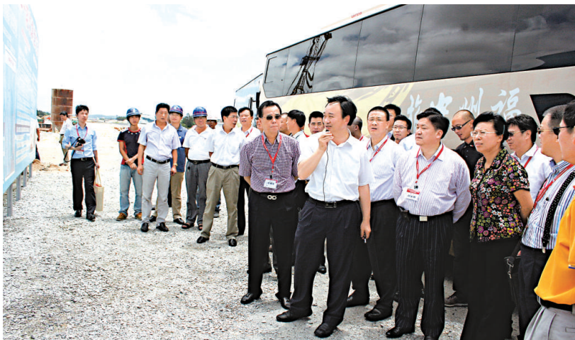
▲代表團在平潭實驗區參訪