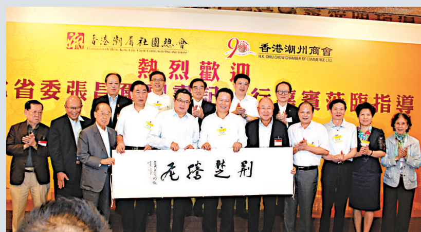
▲賓主互贈紀念品，字幅為國學大師饒宗頤所書