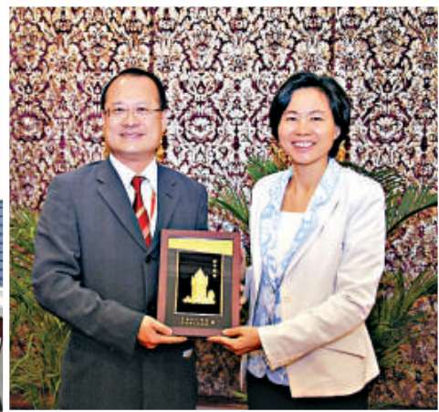
▲江門市市長龐國梅（右）與中總會會長蔡冠深互贈紀念品

中總考察團由會長蔡冠深，副會長袁武、莊學山，珠三角委員會主席曾智雄率領，香港特區政府駐粵辦朱經文主任出任嘉賓。