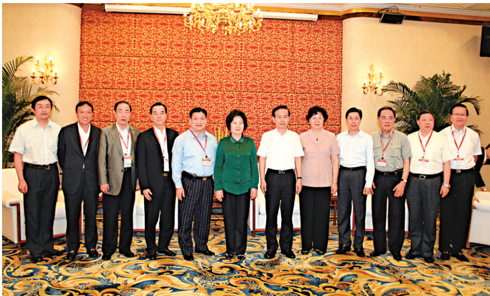
▲福建省領導熱情接見代表團一行，（左起）沈沖、洪祖杭、楊孫西、林樹哲、顏純炯、孫春蘭、蘇樹林、梁綺萍、陳文清、周安達源、楊東成、陳金霖一起合影

代表團訪問期間，在省政協副主席、省委統戰部長雷春美全程陪同下，受到了福州市委書記楊岳、市長楊益民；平潭實驗區黨工委書記、管委會主任龔清概；寧德市委書記廖小軍、市長鄭新聰；廈門市委書記于偉國、市政協主席陳修茂的熱情接待，訪問取得圓滿豐碩的成果。