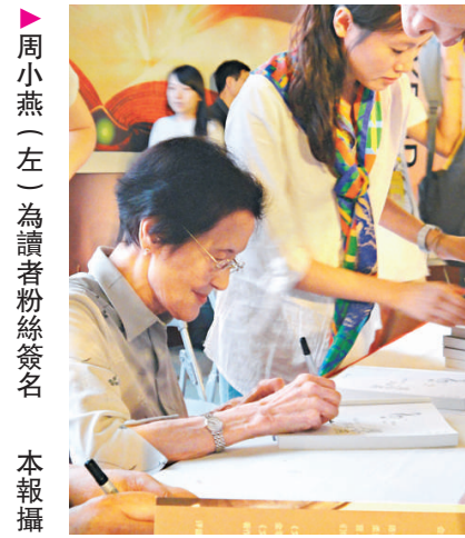
周小燕（左）為讀者粉絲簽名

【本報訊】記者夏薇上海報導：九十五歲的歌唱家、聲樂教育家周小燕日前現身上海書展的中心活動區，為她的傳記《她是這樣一個人——寫真周小燕》簽名售書，這是本屆上海書展熱烈感人的一場簽售活動。上海音樂學院聲樂系常務副主任顧平，紐約大都會第一女高音、上海音樂學院聲樂系副教授李秀英等作為周小燕的得意門生代表前來為老師捧場。在場人士紛紛表示，這會是一本適合各階層人士閱讀的有意義的書，更是藝術工作者不可多得的珍貴教輔書。