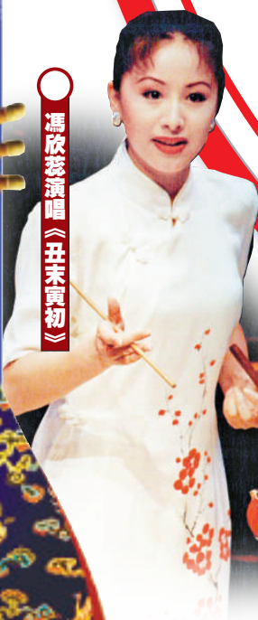
馮欣蕊演唱《丑末寅初》