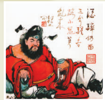
▲郭銀土作品《不喫魚嘴不腥》