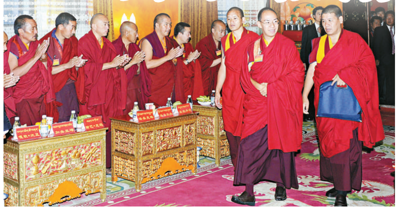
▲班禪活佛(右二)步入會場