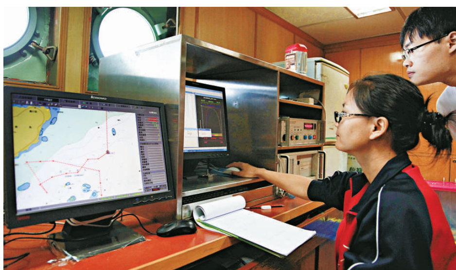
▲科考隊員在船上實驗室內通過儀器進行觀測

陳榮裕指出，海上科考作業與岸上相比不可控的風險要大得多，本地地質探樣絞車出現的意外情況就是一個明顯例證。雖然科考隊員們已經充分考慮到海上因素而特別小心、謹慎作業，但受海況、氣候等條件影響，未來的科考進程難免還會出現一些無法預料的意外情況，全體科考隊員對此都有清醒的認識，也將盡最大努力規避風險，確保科考任務圓滿完成。