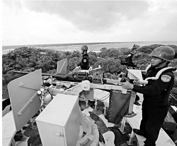
▲目前太平島上駐守人員有台灣海巡署、空軍等單位。資料圖片

根據海巡署提出的太平島守軍射擊計劃，是「防衛火炮及武器實彈射擊」，動用的武器均為傳統武器系統，包括有：81迫炮、20機炮、40榴彈槍、T75班用機槍等；此外，官兵也全數以個人武器65K2步槍、90手槍，在島上的「太平靶場」進行射擊。相關官員表示，預定實彈射擊的武器項目未包括120迫炮及40機炮在內，但「如果海巡官兵接收上手的情況順利，也不排除將這二型武器臨時加入實彈射擊項目內」。