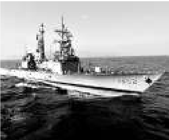
▲台灣向美國購買的紀德艦。

據相關人士透露，台灣海軍當年自美國海軍接收紀德級艦，全案結餘有千萬美元；海軍另外建案對美採購兩套紀德艦訓練官兵用的E化系統，以電子互動模式訓練官兵。其後系統電腦在保修期內損壞，海軍依合約應能免費送修，但美國廠商卻聲稱須送回原產地中國大陸維修；而台灣海軍受島內法令所限不能交給大陸維修，島內廠商也拒絕維修他廠產品，海軍只好等待保修期過後，另外編列經費委由島內廠商維修。