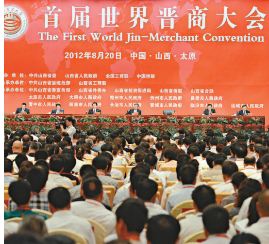
▲20日，首屆世界晉商大會在山西太原開幕，近1500名海內外晉商參會。

戴秉國指出，中國不謀求「世界經濟領袖」的虛名。中國將堅定不移地走和平發展道路，堅定不移地奉行互利共贏的開放戰略。「中國每前進一步，就會為世界多貢獻一份和平的力量、安全的保障和合作的機遇。」