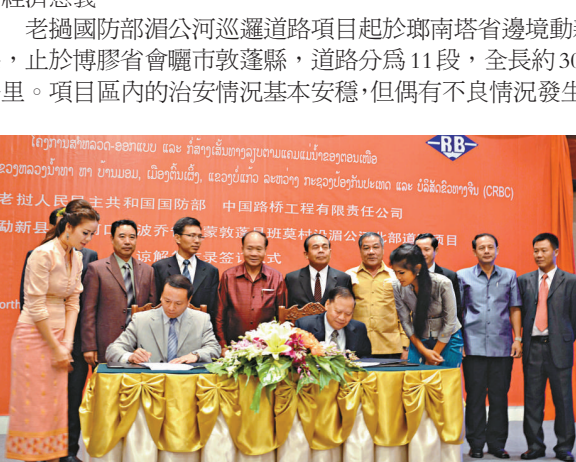
▲19日，在老撾首都萬象，中國路橋工程有限責任公司和老撾國防部就湄公河巡邏道路項目簽署合作諒解備忘錄。

老撾國防部湄公河巡邏道路項目起於鄰南塔省邊境動新縣，止於博膠省會曬市敦蓬縣，道路分為11段，全長約300公里。項目區內的治安情況基本安穩，但偶有不良情況發生。