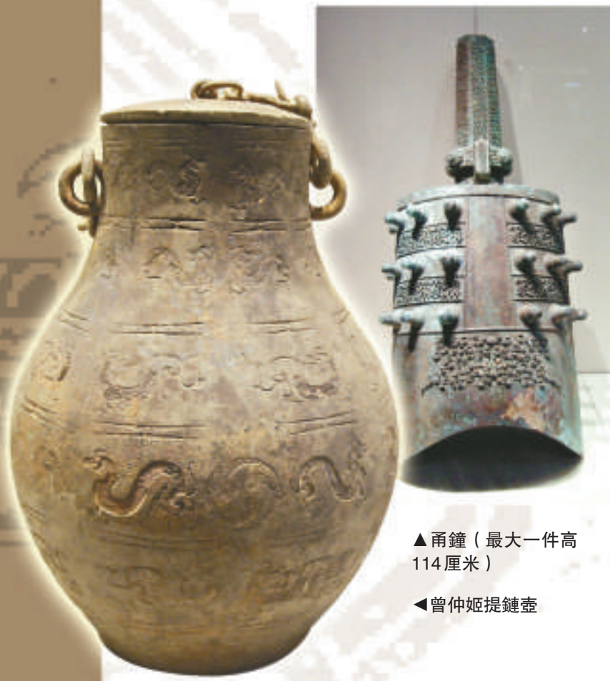
▲甬鐘（最大一件高114厘米）