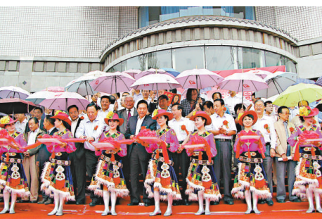
▲眾嘉賓為「隴台文化經貿交流周」開幕儀式主禮

作品包括台灣「立法院長」王金平書寫的「共承龍業」、台灣前海軍司令、上將葉昌桐書寫的「兩岸同心，我們同行」，以及台灣民主和黨主席曾玉鼎、台灣書法家蕭季慧、畫家陳陽春和陳陽照等人的書畫。香港新聞聯聯主席、《大公報》董事長兼社長姜在忠為本次活動題詞：「同為華夏子孫，都是龍的傳人」。