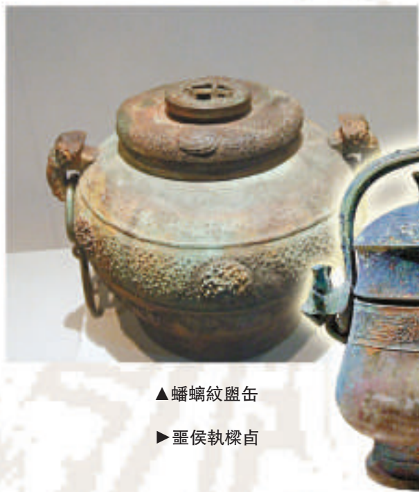
▲蟻螭紋甗 ▶靈侯執棨卣

由深圳博物館、隨州市博物館聯合主辦的「禮樂漢東——湖北隨州出土周代青銅器精華展」正在深圳博物館新館二樓專題展廳舉行，展出文物包括各類青銅禮器、樂器、水器、兵器等八十一件（組），其中近半數文物都是近五年來的考古新發現。展品中，最重要的要數安居羊子山墓地出土的靈（鄂）國青銅器。