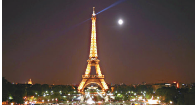
▲艾菲爾鐵塔價值4340億歐元，是歐洲眾多名勝中的「首貴」

上午10點在倫敦西部的梅爾克舍姆家中平靜去世，他感染了肺炎，之後身體狀況急速惡化。威爾特郡警方表示，他們沒有參與處理這件事情，也沒有驗屍官涉入其中，意味着這沒有什麼可疑的地方。一名發言人說：「醫生定期來查看他的病情，他將會在死亡證明上簽字。」尼科林森的家人通過尼科林森的Twitter發布了這樣一條消息：「在他死前，他讓我們代他說：『再見了，這個世界。已經到時間了，我也曾經開心過。』」