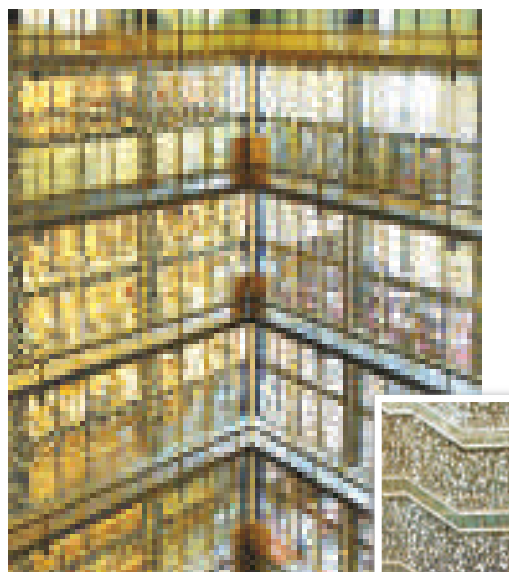
▲紐約大學博布斯特圖書館裝上20英尺的高金色金屬圍欄，以防止學生跳樓自殺 《紐約郵報》

裸照事件發生於拉斯維加斯一家五星級酒店 《每日郵報》 英民眾撐率真王子 哈里王子的這一行為是否會損害英王室的形象？ ■是的，他代表了英王室，這樣的舉止是完全不適宜的。23.28% (1462票) ■不會，他只是一個普通年輕人，而他這樣率真的表現對王室反而更好。46.48% (2919票) ■他全裸其實不算什麼，但被拍了照片就很愚蠢了。28.11% (1765票) ■我絕不認同此類事情。2.13% (134票) 《每日電訊報》