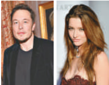
▲PayPal公司的創辦人埃隆·馬斯克與前妻英國演員萊麗 《每日郵報》

【本報訊】據英國《每日郵報》22日報道：作為PayPal公司的創辦人埃隆·馬斯克曾經的妻子，萊麗竟然只分得420萬美元。對於26歲的英國演員萊麗來說，這筆交易不算太壞，畢竟他們的婚姻只維持了兩年。但是從馬斯克價值20億的身家來看，這筆錢未免有點太少了。馬斯克在科技行業的巨大成功使他身價不菲。《紐約時報》將馬斯克稱為「不披盔甲的鐵甲奇俠」，這是他9年來的第二次協議離婚。萊麗可以保留離婚前得到的卡地亞和古馳手表、各式各樣的珠寶以及價值11萬美元的斯特拉車。馬斯克是南非人，畢業於賓夕法尼亞大學，他創立了許多非常成功的企業，並由此發家。最早的一間公司叫做Zip2，主要製造線上內容發布軟件，1999年以3.4億美元的價格賣出。之後，他又幫助創辦了線上轉帳支付服務提供商PayPal，Ebay公司於2002年用12億美元的價格將其收購。