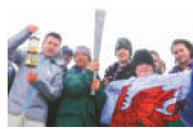
▲倫敦奧組委主席科·塞巴斯蒂安勳爵（左一）在斯諾登山舉手持裝有燧火的礦工燈籠

【本報記者黃念斯倫敦22日電】為點燃2012殘奧會火炬，英格蘭、威爾士、北愛爾蘭和蘇格蘭4地的童子軍22日分別攀登各地最高山峰採集燧火。包括傷殘少年在內的4地童子軍經過4小時的登山跋涉，分別登上英格蘭的斯卡菲爾派克山、威爾士的斯諾登山、北愛的斯拉夫·唐納德山，以及蘇格蘭的本尼維斯山。他們將在4地山峰用鍍金合棒撞擊鋼片取火，然後將火種放在傳統的礦工燈籠內，分別送到倫敦、卡地夫、貝爾法斯特和愛丁堡。隨後數天，4大城市將分別用不同方式，舉行迎接殘奧會火種的儀式。倫敦將在24日於市中心特拉法加廣場進行燃點殘奧聖火壇的慶祝活動。倫敦奧組委主席科·塞巴斯蒂安勳爵呼籲國民像支持奧運會一樣繼續支持殘奧會。他說，殘奧聖火來自英國4地最高山峰，象徵着殘奧運動員不畏困難的拚搏精神。殘奧會火炬是銀色的，形狀與奧運火炬基本相同，據介紹，殘奧會火炬用鋁合金製成，較輕，但更耐熱。4地火種將於本月28日聚集到白金漢宮的斯托·曼德維爾醫院，那裡是英國第一次舉行殘奧會的地方。28日晚上8時，2012殘奧會火炬將在這裡被點燃，繼而開始24小時的殘奧會火炬傳遞。116名殘奧火炬手將接力跑完92英里，於8月29日晚8時完成傳遞，抵達倫敦東奧運公園主運動場。殘奧會開幕式定於29日晚舉行。2012殘奧會為期10天，9月9日結束。