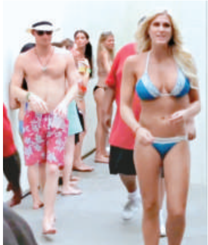
▲哈里在拉斯維加斯度假期間，被拍到參加泳池派對