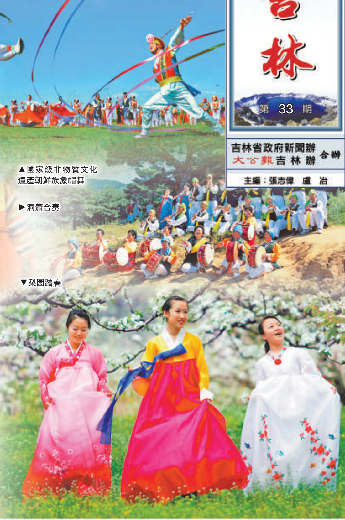
國家級非物質文化遺產朝鮮族象帽舞