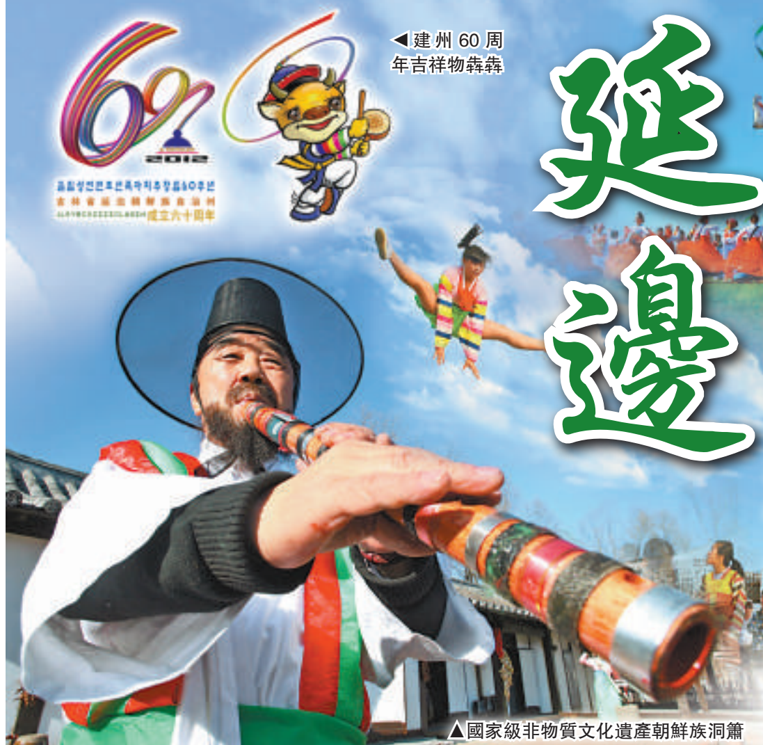
建州60周年吉祥物犇犇