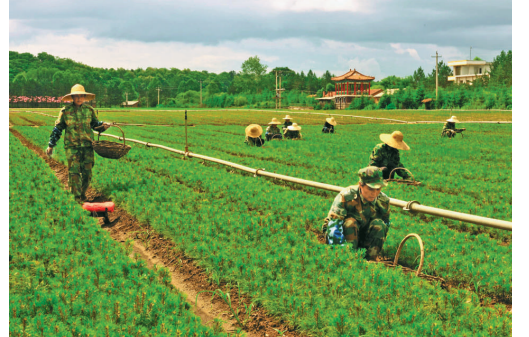
為生態建設提供優良苗木

作開發，取得了突破性成就，已經成爲中國面向東北亞開發開放的橋頭堡。中朝共同開發和共同管理的羅先經濟貿易區順利推進，對俄經貿合作不斷深入。對外通道建設取得重大突破，圈河口岸至朝鮮羅津港公路改造工程完成，環卡鐵路千萬噸國際換裝站項目扎實推進，陸海聯運航線、內貿貨物跨境運輸正式開通，「借港出海」目標初步實現。開放平台承載功能不斷增強，工業集中區建設有序推進，延吉開發區升級爲國家級高新區，延邊州成爲第三批加工貿易梯度轉移重點承接地。對外貿易呈現旺盛活力，2011年外貿進出口總額18.6億美元。積極推進延龍圖一體化，三市交通、金融、通信等同城發展取得初步成效。