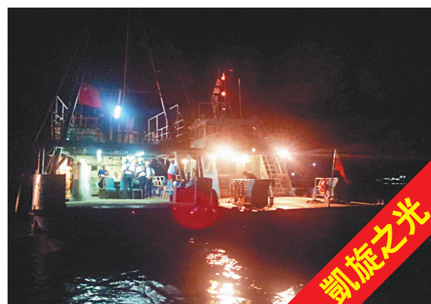
▲前日凌晨進入香港水域