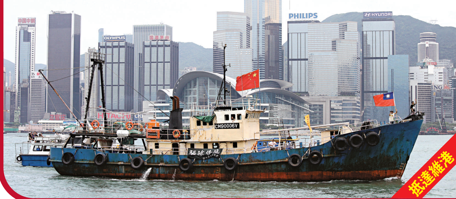
▲二十二日下午二時，七名保釣勇士及船員乘坐保釣船「啓豐二號」駛進維港