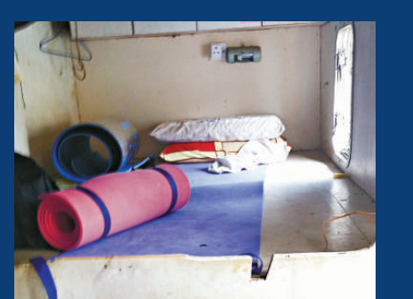
▲保釣船上設施極為簡陋