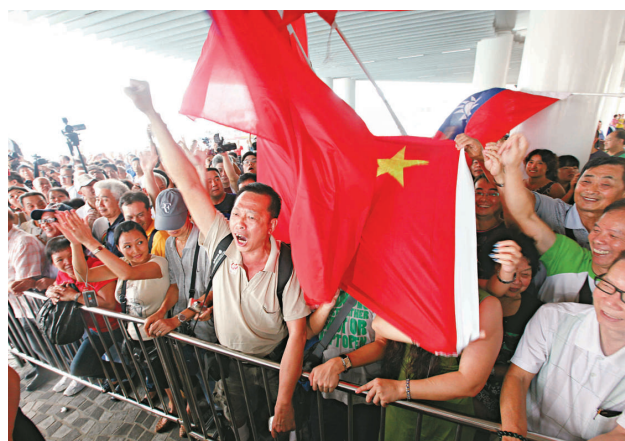
▲市民揮舞國旗高呼「歡迎歸來」