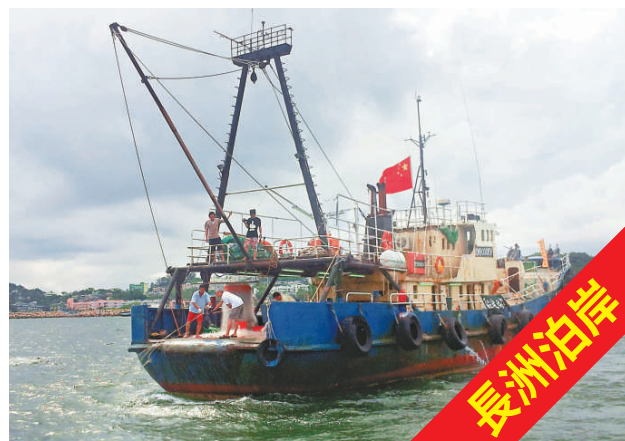
▲昨日早上在長洲附近海域捕魚