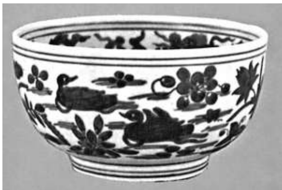
嘉靖時期官窯所採用的青料，主要是回青料，有時以回青和瑞州石青配合使用；故沒有永樂、宣德和元代青花那種黑鐵斑，風格並非冷峻高貴。

嘉靖時期官窯所採用的青料，主要是回青料，有時以回青和瑞州石青配合使用；故沒有永樂、宣德和元代青花那種黑鐵斑，風格並非冷峻高貴。由於嘉靖青花瓷器傳世甚多，燒造數量大，雖有收藏價值，但升值率不高。若退而思其次，明代晚期嘉靖時代燒製者，其實亦可算是一大突破。雖然胎質不及明初三朝，甚至偶有粘砂現象與跳刀痕；但小件如碗、筆架、水洗、杯和盒等，仍保持質堅胎薄、造型規整和製作精細。