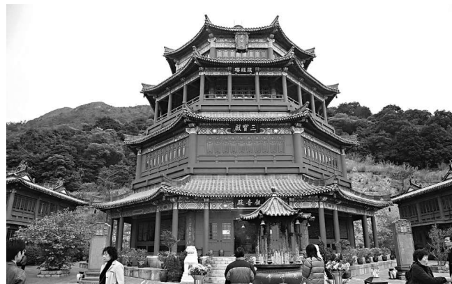
觀音寺內以八角形四重簷設計的三寶殿

三寶殿的中層為藏經樓，存放「三藏十二部」和其他佛教典籍，並奉有觀音、文殊和普賢三位菩薩。頂層的萬佛閣供奉五方佛，居中的毗盧遮那佛在四座佛像襯托下尤其突出，圓拱頂布滿萬尊小佛像，金光閃閃，益增莊嚴氣氛。