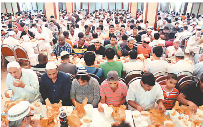
九龍清真寺在齋月黃昏為穆斯林提供飲食

最近偶然聽到一名印尼僱工與本地婦人對話，說她正在齋戒，使我醒覺伊斯蘭教的齋月又來臨了。齋月是伊斯蘭曆第九個月，此曆法以月亮的出現周期計算，一年分十二個月，每月有三十日或二十九日，不設閏月，一年的總日數比陽曆少約十一日，每隔二點七年相差一個月，因此每年齋月都在陽曆的不同日子。 齋戒是伊斯蘭教「五功」（需遵守的五項基本原則）之一，每年齋月，年滿十二歲的穆斯林每日由拂曉開始就不吃不喝，直至黃昏才可進餐。對於需要體力勞動的人來說，得靠意志力去支持。有不少穆斯林在清晨四時許摸黑起床，吃點食物，再小睡片刻，才開始迎接新一天的工作。 穆斯林每日五次禮拜亦是「五功」之一。清真寺根據現時季節，定出晨禮在清晨四時四十分舉行，晌禮在下午一時，晡禮在下午五時十分，昏禮在傍晚六時五十五分，宵禮在晚上八時二十分。 九龍清真寺在齋月期間，每天昏禮之後免費供應簡單飲食給予到來的穆斯林。寺內的大堂擺滿桌椅，每個座位放置一份飲食，合共一千八百多份，有家鄉小吃、水果、米粥和果汁等。大家無分種族，不論貧富坐在一起，先參加由阿訇主持的昏禮，之後開始進食。對於餓了一整天的成年人來說，這一點食物是不足夠的。他們回到家後會再吃一頓，填飽肚子，以應付翌日所需消耗的體力。