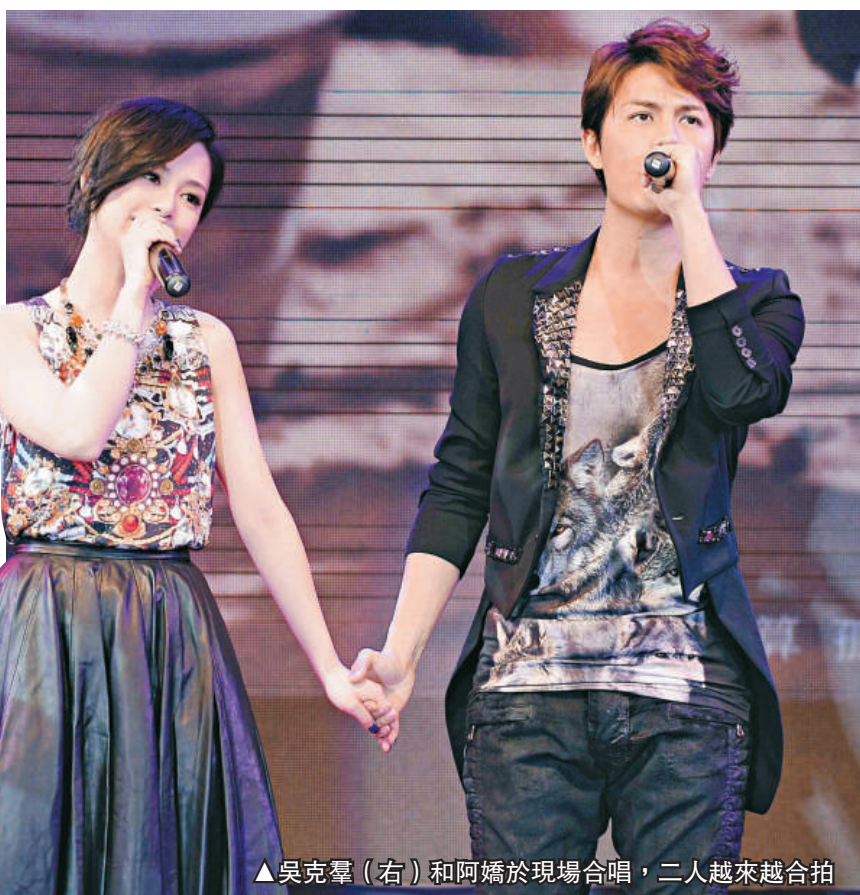
▲吳克羣（右）和阿嬌於現場合唱，二人越來越合拍

另外，克羣大讚到場的阿嬌工作認真、人美花嬌。阿嬌亦讚吳克羣是不可多得的音樂才子，表示十分欣賞，更稱未來兩人還會給大家帶來更多驚艷的合作。二人讓傳媒拍照時，吳克羣更扮演「人形立牌」，任阿嬌「纏身」。