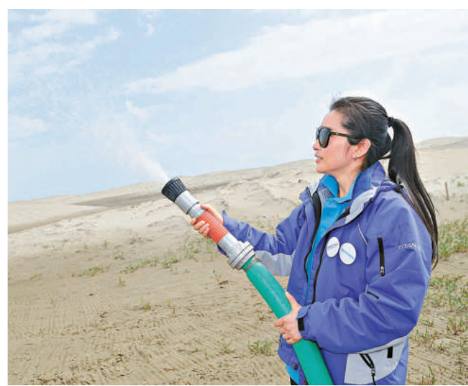
▲李冰冰親自向沙化地帶噴灑水藻