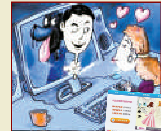
▲►網絡徵婚已成新趨勢，各類徵婚網站和廣告良莠不齊