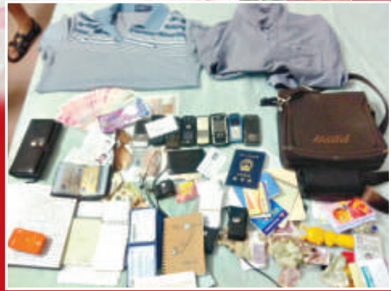
▲一名內地男子訛稱港人在深圳騙婚騙財40多萬元被深警抓獲，並繳獲部分作案工具及財物