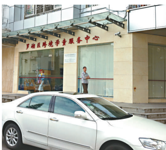
▲羅湖婦女活動中心每年都接獲不少於五宗假婚、騙婚的求助個案

為遏制假婚、騙婚的現象，內地近期已實現婚姻登記信息全國聯網。民政部社會事務司司長俞建良近日透露，民政部門下一步將積極推動與法院系統判決、調解離婚信息，與外交部門境外辦理婚姻信息以及港澳台地區婚姻信息的查詢、交換和共享工作，逐步建立完善的「全國公民婚姻狀況數據庫」建設工作。