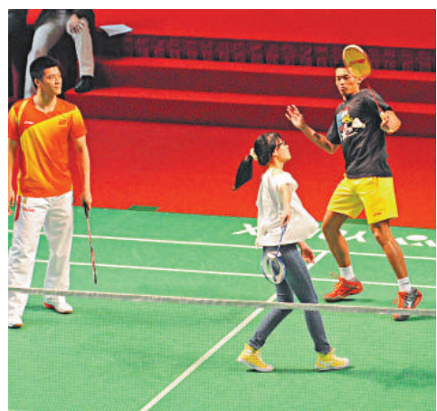
▲獲抽選與林丹(右)、傅海峰(左)一起打球的女孩，揮拍落空，嚇得林丹也要退避，場面搞笑

另外，羽毛球表演賽中其中一戰是由國家隊李雪芮對戰本港羽毛球青年軍小將吳芷柔。吳芷柔面對金牌球手毫不怯場，與李雪芮球來球往，贏得觀眾陣陣掌聲。吳芷柔於表演完畢後興奮地表示，賽後獲李雪芮送了一個羽毛球袋，勉勵她日後要努力訓練。