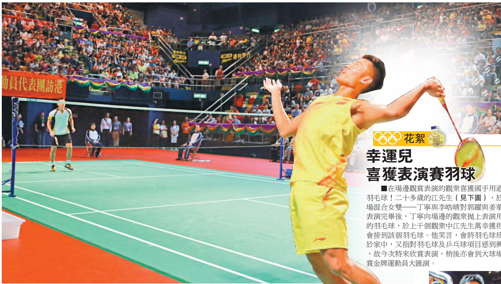
▲林丹在廣大香港觀眾面前表演招牌扣球