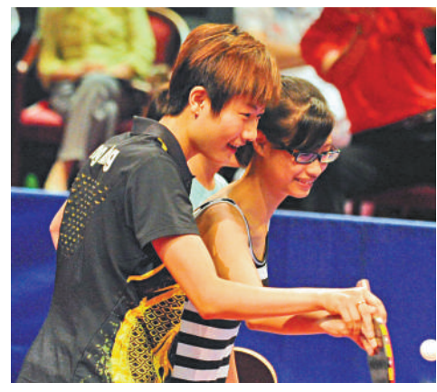
▲丁寧耐心地教導小女孩