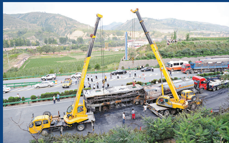
▲事故現場已開始清理。