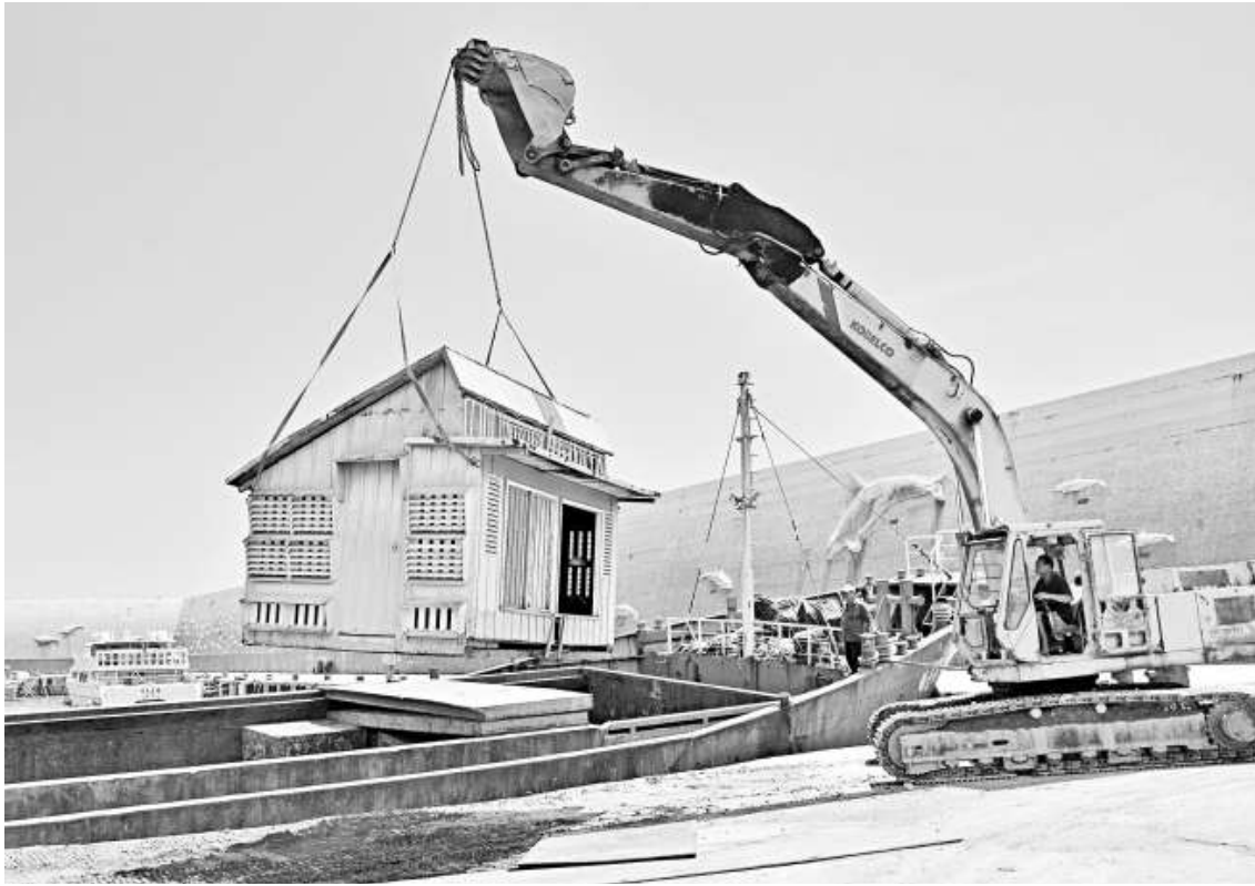
▲綠島鄉可能再次受「天秤」侵襲，26日兩艘貨輪滿載物資進入綠島

27日開始「2012國泰夢想豪小子林書豪籃球訓練營」，為期4天的訓練營結束後，林書豪還會出席汽車品牌活動。林書豪也將參加好消息電視台舉辦的晚會，分享宗教對他人生、打球的影響力，預計9月3日離開台灣。