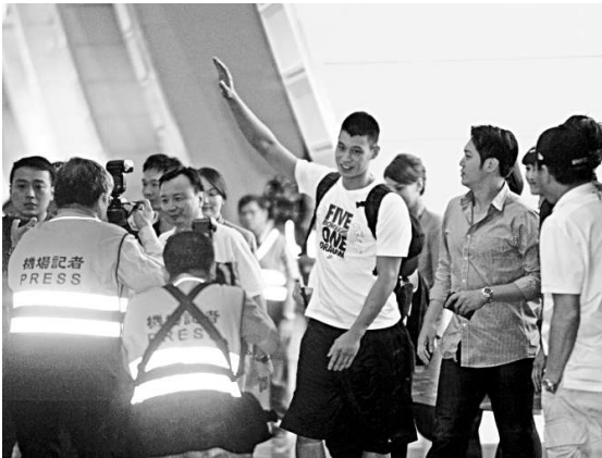
▲球星林書豪26日晚間抵達桃園國際機場，此行主要參與籃球訓練營，並出席公益活動

自1989年開始，陳啓安發動廣州的台商常年開展扶孤助學等活動，到現在他都記不清自己到底資助了多少貧困學生及孤兒。他還鼓勵員工和自己的親友募款捐助失學的孩子，慈善之舉遍及湖南、四川、貴州、甘肅、內蒙等地。