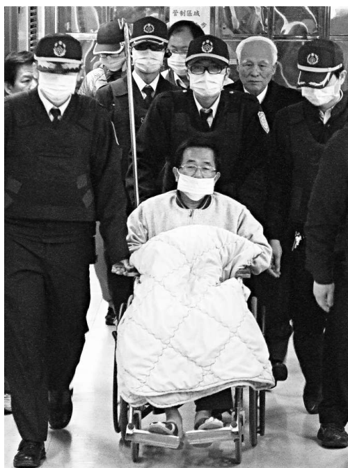
▲馬英九指出，保外就醫不同於戒護就醫。圖為陳水扁今年戒護就醫的場面

馬英九不接納郝龍斌的「救扁論」，並不出乎意料。如果扁不符合保外就醫條件，而馬英九又網開一面，日後的麻煩事可能更多。因為這將成為先例，日後倘若又有高官犯案，是否又可以如此操作呢？此外，依馬英九嫉惡如仇的法律人格，他不可能做出「違法違規」之事。從他處理國民黨黨務的手法就可看出，他一切按規辦事，挑選選舉候選人的首要條件是清廉，即使可能敗選也不改初衷。除非扁確實符合保外就醫的條件，恐怕馬英九還是會站穩自己的立場。