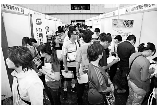
▲島內經濟不景，企業大量裁員。圖為民眾在就業博覽會碰運氣

勞工局將介入處理。據台北市勞工局統計，2008年受理的大量解僱案件為41家、4698人，2009年為26家、1267人，2010年12家、485人，2011年35家、1535人。跟往年相比，今年才過了三分之二，解僱人數已經追去去年一整年的紀錄，僅比去年少4人。