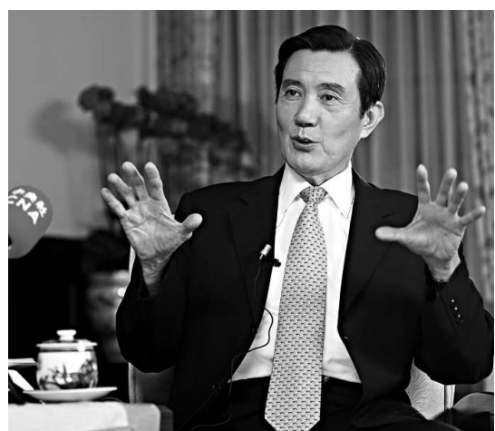
▲馬英九表示，陸資入島有開放的空間

針對釣魚島問題，馬英九表示，釣魚島問題已到了要解決的時機，台灣有一套做法，將視實際情況發展提出；他所提「東海和平倡議」不排除以任何方式持續推動。