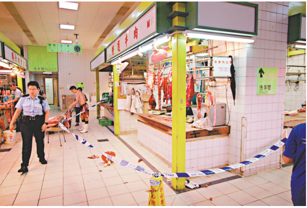
▲男子發狂揮舞牛肉刀現場

抹窗墮樓意外經常發生，有清潔業人士指出，市民抹窗時不要貪方便移除窗花，也要避免探身出窗外；應借助伸縮梯等工具清潔。使用矮梯等物墊腳時，除了注意是否穩妥平衡，也要確保地面沒有濕滑，同時避免以窗門或窗框借力，俱有助防止意外。