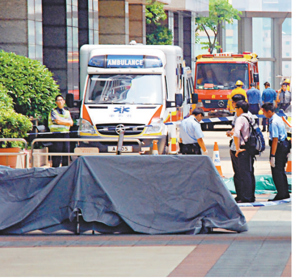
▲警員以帳篷遮蓋屍體