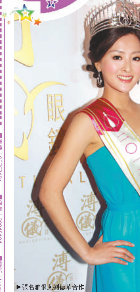
張名雅與劉德華合作