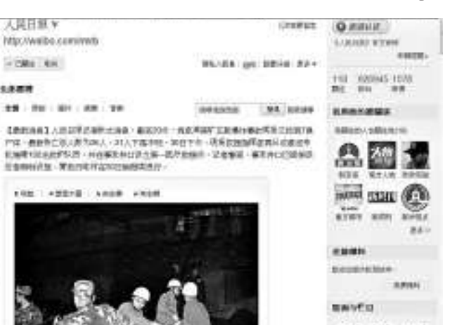
▲內地媒體指出，以網絡為依託的新媒體徹底改變了中國社會的生態，對政府的治理構成了挑戰。圖為人民日報於上月中旬推出的官方微博，目前粉絲已近百萬