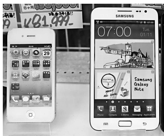
▲美國蘋果公司的iPhone 4s手機(左)與韓國三星Galaxy Note系列手機(右)