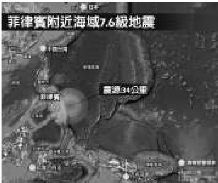
菲律賓附近海域7.6級地震

當地電台說，南部城市卡加延德奧羅有一座房屋倒塌，菲律賓中部和南部一些城鎮電力中斷。