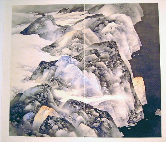
▲陳鏡田國畫《雲海相擁》