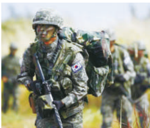
▲韓國部隊進行軍事演習 資料圖片

另據韓國國防部官員透露，韓國空軍的南部戰鬥司令部原定於3日至6日訪問日本與自衛隊指揮官進行交流的計劃被延期。