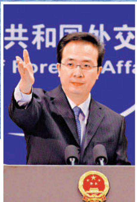
▲中國外交部發言人洪磊表示，日方企圖通過所謂「國有化」強化其非法立場的圖謀是徒勞 資料圖片

【本報訊】綜合共同社、日本新聞網、中央社3日消息：日本政府3日證實，已正式與釣魚島（日本稱尖閣諸島）的「所有者」展開「購島」談判，「所有者」有意向中央政府出售島嶼，爭取在本月內達成相關協議。日本媒體也報導稱，中央政府擬出資20.5億日圓（約2.03億港元）購買釣魚島，將在下周11日的內閣會議上決定「國有化」方針。對此，中國外交部3日重申，日方為「國有化」釣魚島所做的一切，都是非法徒勞的。