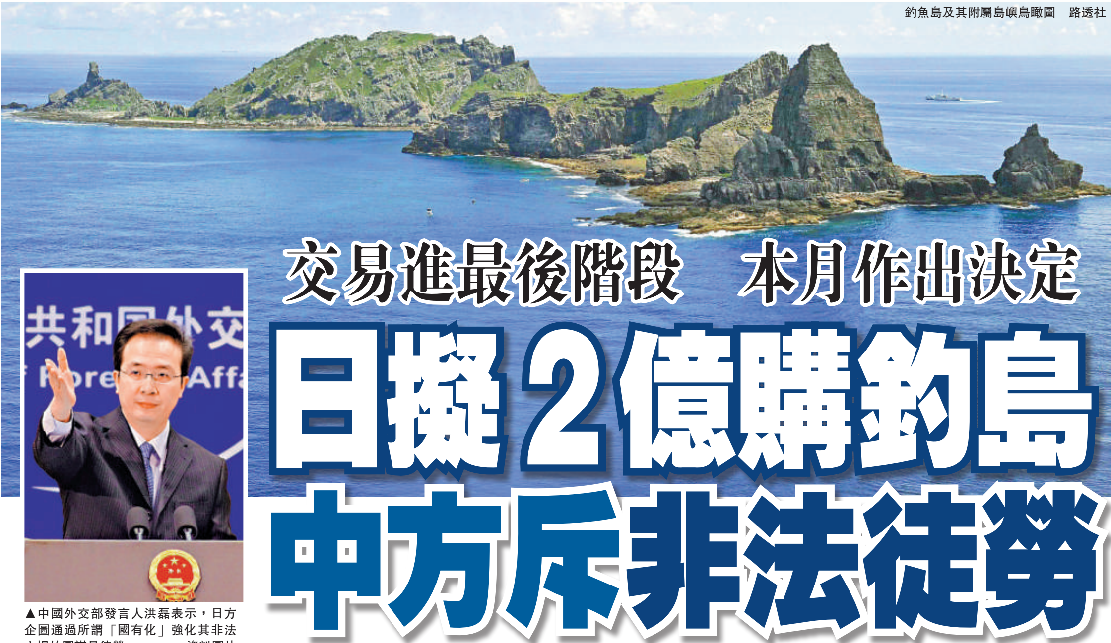
釣魚島及其附屬島嶼鳥瞰圖