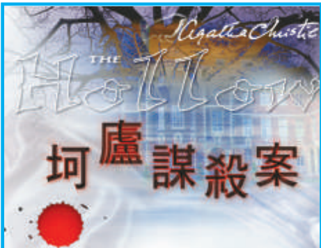
▲《珂廬謀殺案》改編自英國推理小說家阿嘉莎·克莉絲蒂的同名小說