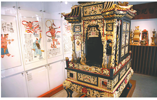
昔日哪吒像出巡時所用的鑾輿

每一型號、不同年份出廠的老爺機械名廠腕錶，一定有獨特「版路」及內部機件構造，與其他型款者設計有別。像附圖，乃一九五六年「勞力士」廠製造的蠔式Rolex大三針包金腕錶之內部機件結構；「版路」是真是偽，識者一目了然，使一些弄虛作假者無所遁形。多細察、多接觸、多研究、多比較，是學習與熟悉古舊機械之不二法門；並無捷徑或僥倖成分。否則，輕易為人所愚；表面上十分吸引的名廠機械腕錶，但實際上金玉其外，敗絮其中。一些偽「翻寫面」名表，表殼是K金或包金，可是內部配上的竟然是普通雜牌舊表的機件，或大部分皆屬裝裝而非原裝機件，無甚珍藏價值。