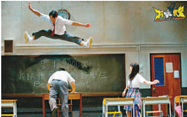
▲《打轉教室》中有不少跳躍和翻騰的動作