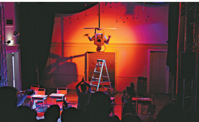
▲《打轉教室》是沒有一句對白的「動作喜劇」