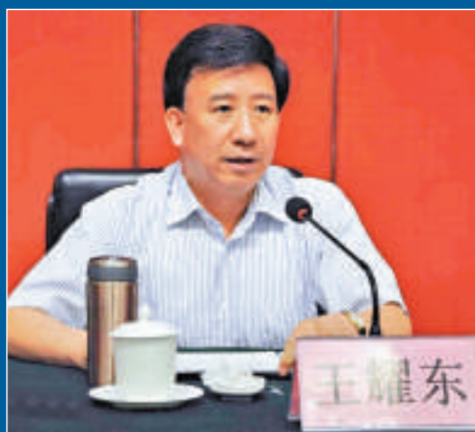
▲國家信訪局副局長王耀東坦承，當前信訪工作仍面臨較為嚴峻的形勢

、人力資源和社會保障部副部長楊志明說，將加大督導檢查力度，加大重點案件處理力度，加大對突出問題的研究解決力度。楊志明說，「首都穩，全國穩」，北京的信訪維穩工作至關重要。赴廣東的中央信訪