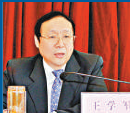
▲督導組主要由中央聯席會議辦公室派出，圖為辦公室主任、國家信訪局局長王學軍