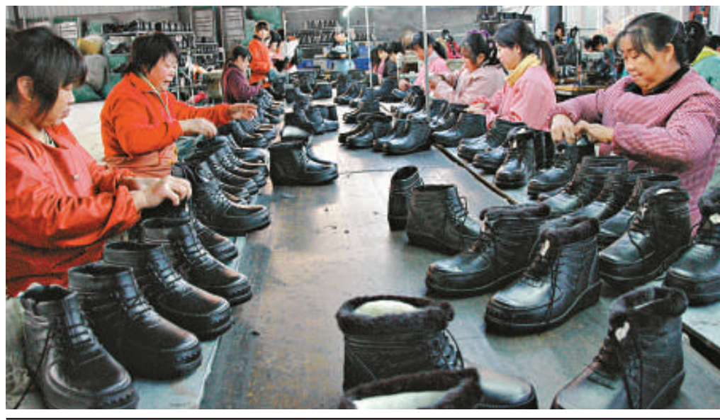
▲製造業生產成本上升，中國製造業「低成本優勢」正在消失

「盡快實現從低端向高端的轉型升級，是中國製造業的必然選擇。」中國企業研究院首席研究員李錦表示，應提升基礎管理水準，堅持自主創新，重視品牌培育和保護，提高國際化經營水準，讓製造業與服務業融合發展，推動信息化與工業化深度融合，建設新工業化基地和園區，形成製造業轉型升級新載體。