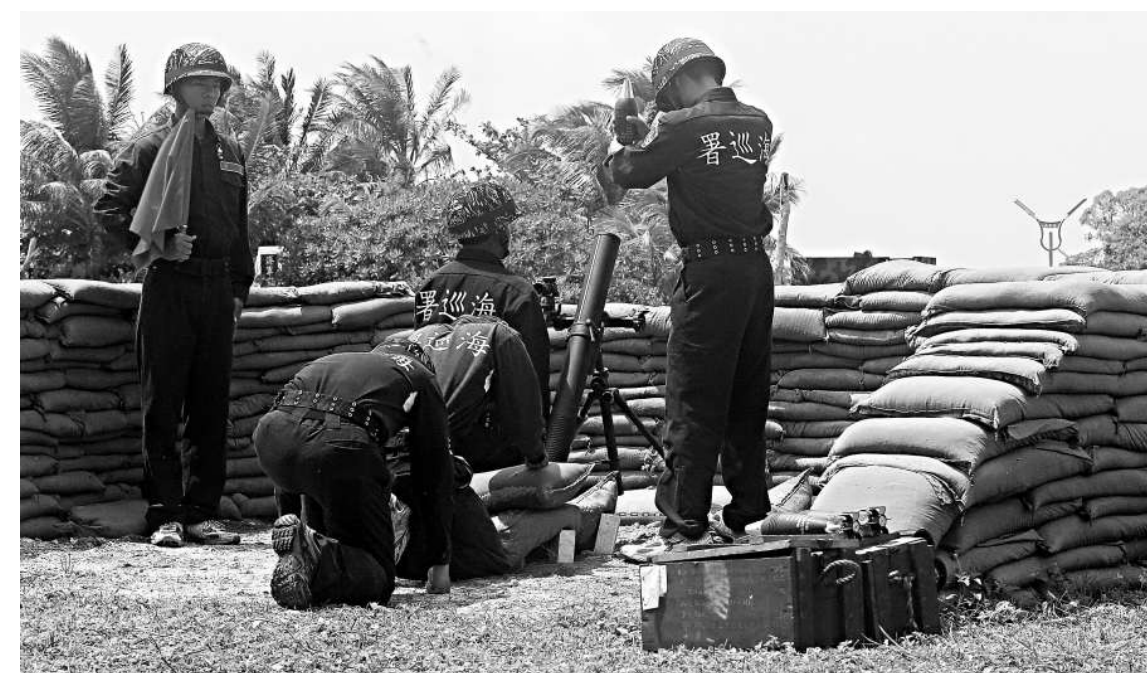
▲島內立委5日前往太平島，視察駐島海巡人員實施實彈射擊操演。圖為81公厘迫擊炮實彈射擊操演資料圖片

戰車登陸艦每季實施重型物資運補1次，另每年海軍敦睦隊均赴南沙海域巡弋；還有空軍每兩個月以C-130運輸機飛往太平島執行「聯平操演」1次，並藉海洋長途飛行能力訓練時機，兼施南巡巡弋。