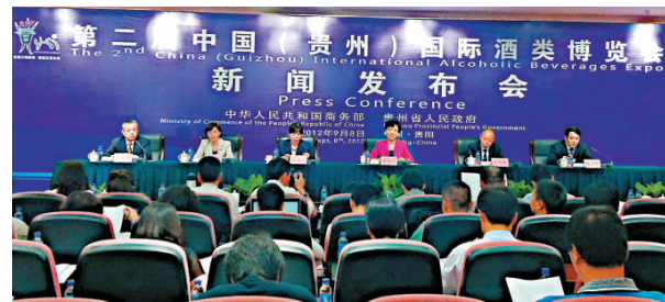
▲新聞發布會現場

另據消息，茅台之鄉仁懷市現共擁有國家、省級及行業名酒牌產品55個，其中，4個白酒品牌入選「貴州十大名酒」，並擁有貴州著名商標68件，中國馳名商標4件，酒類商標總數佔貴州省的80%以上。