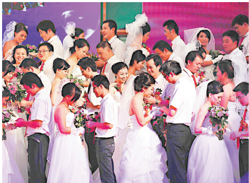
▲9日晚，99對異地務工青年在廣州開發區舉行集體婚禮，與大家分享在廣州開啓新生活的幸福

【本報訊】為期2天的2012秋季中國婚博會(廣州站)9日閉幕，直至下午4時，場內仍然人氣火爆，幾乎所有展位均座無虛席、所有櫃台前人頭攢動。據了解，僅廣州婚慶市場年產值達3億元左右，業內人士呼籲儘快建立婚慶行業標準體系。據中新社報道，廣州海上絲路文化公司總經理姜茂林指出，目前廣州每年結婚人數(本地登記)約為10萬對，高、低峰年份會有20%左右上下浮動。除去買樓買車，僅以婚慶花費此項，百分之百新人會拍婚紗照、六至八成新人會辦酒席、50%的新人會請婚慶公司承辦婚禮。以每對新人平均花費2萬元用於婚慶，廣州的婚慶市場每年可達兩三億元人民幣。