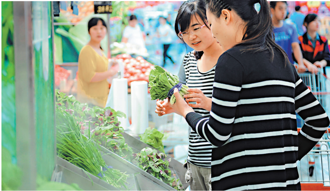
▲9日，市民在合肥市一家超市挑選蔬菜

交通銀行金融研究中心王宇雯指出，儘管新漲價因素上漲壓力存在，但年內物價反彈幅度有限。雖然9月份國內成品油價可能再次上調，但由於前期已有「三連降」，且近期市場價格對國際油價上漲有所提前反映，預計調價對未來新漲價因素的短期推動作用不大。